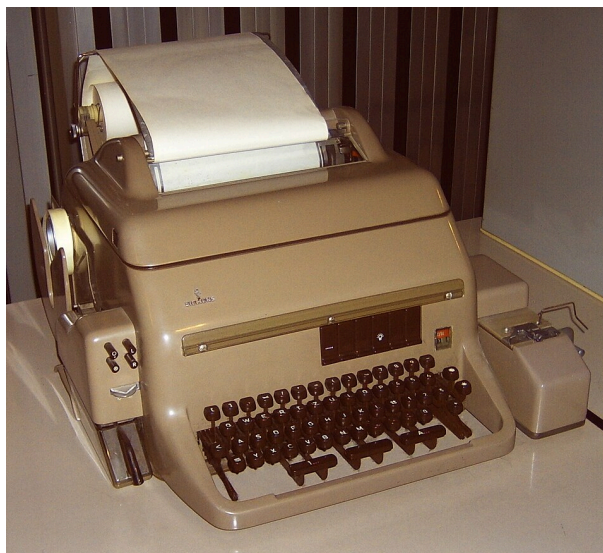
Abbildung 3: Der Fernschreiber T100 Siemens.

Anfang des 20. Jahrhunderts verbreitete sich eine Weiterentwicklung des Morsetelegraphen: der Fernschreiber. Abbildung 3 zeigt ein Beispiel davon aus dem Jahre 1958. Im Grundsatz handelt es sich um zwei Schreibmaschinen, die miteinander verbunden sind. Wenn auf der einen Schreibmaschine etwas geschrieben wird, wird dasselbe auf der Empfänger-Maschine getippt. So können einfach und schnell Nachrichten übertragen werden. Bei manchen Modellen konnte die Eingabe auch von einer Lochkarte (s. Titelbild) eingelesen werden.